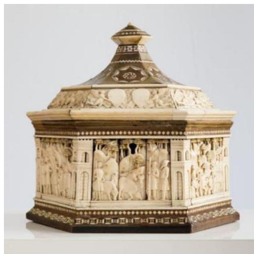
Coffre de mariage, scènes de la vie vénitienne, vers 1390-1410 Venise ou Florence Floriz Van Wanroij Fine Arts

Si la peinture ancienne n'est pas le point fort de la BRAFA, il n'en va pas de même des artistes modernes et contemporains. Les galeries les plus réputées du royaume et celles qui viennent de l'étranger y exposent les plus belles signatures.