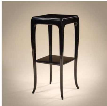
Jean Dunand (1877-1942) Table en laque noire, vers 1921 Galerie Mathivet

Dans une ambiance sympathique, décontractée et chic, typique du savoir-vivre belge, le visiteur parcourt le monde et les siècles à la recherche de l'objet qui le séduira au point de le vouloir au plus vite chez lui dans son salon. Le choix est vaste. Depuis de nombreuses années, les spécialistes de l'archéologie et de la plus Haute Antiquité ont affûté leur sélection et présentent souvent des objets exceptionnels. La démarche est la même pour les galeries qui défendent les arts d'Asie, d'Afrique ou d'Océanie.