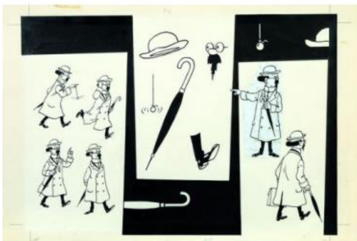
Hergé (1907-1983) Portrait de Cuthbert Calculus, le professeur Tournesol, 1968 Belgian Fine Comic strip Gallery