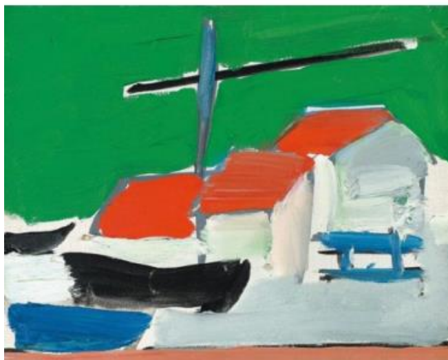
Nicolas de Stael (1914-1955) Les Mardiques, 1954 Bailly Gallery

Mais cette bonification ne se fait pas au détriment du portefeuille du visiteur. Si l'on trouve des œuvres à des prix considérables, on peut également acheter toute une foison de très beaux objets pour moins de 5 000 euros.