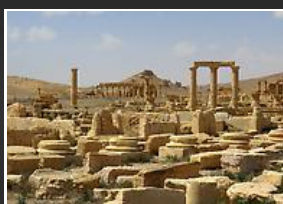
Muestran sitio arqueológico de Palmira tras recaptura