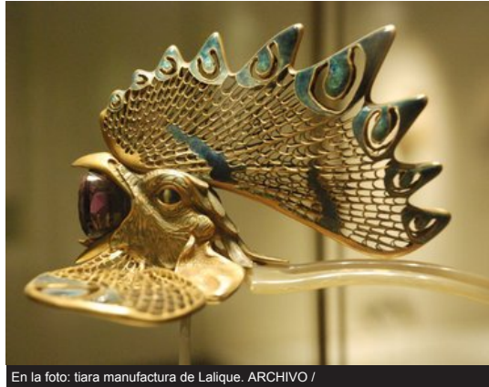
En la foto: tiara manufactura de Lalique.

Subastas | Patrimonio | Holanda | Difusión del arte