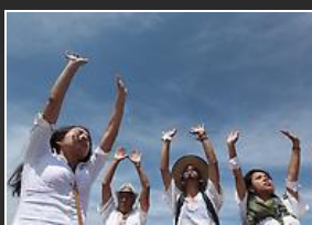
Reciben la primavera y se cargan de energía