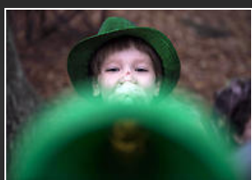
Se tiñen de verde para festejos de San Patricio

EL INFORMADOR valora la expresión libre de los usuarios en el sitio web y redes sociales del medio, pero aclara que la responsabilidad de los comentarios se atribuye a cada autor, al tiempo que exhorta a una comunicación respetuosa.