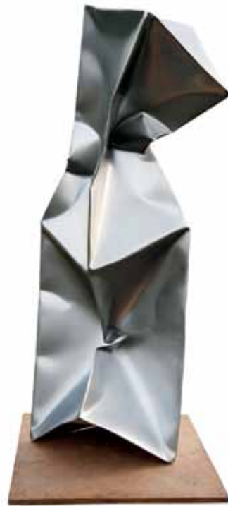
Ewerdt Hilgemann, Stretched Double, 2008, acier inoxydable, 240 x 60 x 60 cm, poids : 82 kg. Prix indicatif : 90.000 €

« Nous sommes toujours curieux de savoir ce que nos collègues proposent, bien sûr, notamment Sperone Westwater de New York. La foule ne me permettra pas de faire tranquillement le tour de la foire, mais j'irai quand même voir la très jolie petite section de 'Works on Paper', dont la qualité est parfois prodigieuse »