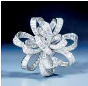
Merveilleuse broche Art déco 'flot de rubans' de Van Cleef & Arpels, ca 1937, Paris. Cette broche en platine, en forme de nœud, est sertie de diamants (total ± 24 ct). Karl Lagerfeld a lui aussi une affection particulière pour cette pièce dont il dit : « J'aime le tourbillon de ce nœud sans fin, qui se termine en fleur ».