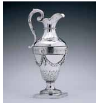
Cette cruche à vin constitue un superbe spécimen de style néoclassique, avec ses ornements de grènetis, feuilles de palmier, couronne de feuilles de laurier, cannelures et lourdes guirlandes coulées de feuilles de laurier fixées au corps. Ces grandes cruches à vin en argent étaient rares dans la seconde moitié du XVIIIe siècle.