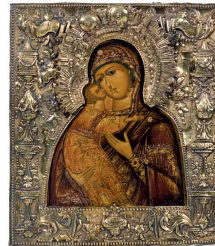
Mère de Dieu de Vladimir, Russie, fin du XVIIIe siècle, 31,5 x 26,9 cm. Enrichie en 1800, d'une riza en vermeil de Grigory Shishkin de Volgoda. Prix indicatif : 15.000 € La Mère de Dieu de Vladimir appartient au type Elousa, la Mère de Dieu de la tendresse. En effet, l'étreinte de la mère et de l'enfant, où l'enfant pose sa joue contre celle de sa mère, témoigne de beaucoup d'amour.