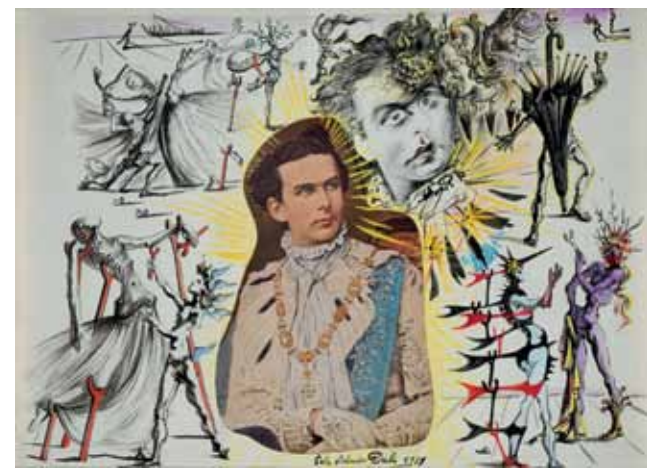
Salvador Dalí (1904-1989), dessin pour Bacchanale avec Louis II de Bavière, 1939, encre, aquarelle, gouache et collage sur papier, 20,2 x 27,6 cm. Cette œuvre est un dessin très détaillé et élaboré pour la représentation du ballet Bacchanale. Le ballet, sur une musique du Mont de Vénus de Wagner représente Louis II de Bavière en proie à des visions. Cette thématique a permis à l'artiste de mettre en images toutes ses obsessions et ses dadas.