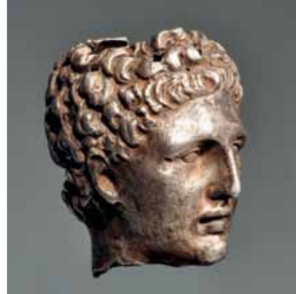
Tête de Héros en argent, période hellénistique, IIIe-IVe siècles av. J.-C. H. 7 cm. Des sourcils marqués surmontent des yeux très enfoncés dans le visage ovale de ce jeune homme. Les lèvres sont légèrement entrouvertes et il porte un fin diadème dans les cheveux. Détail remarquable: la petite plaie au coin de son œil droit.