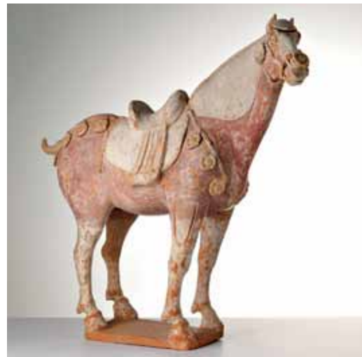
Modèle en argile non émaillé d'un cheval sellé. Chine, période Tang (618-907). H. 49 cm. Ce cheval est représenté avec une selle, une couverture de selle et des ornements en forme de rosettes. Ces célèbres chevaux Ferghana étaient indispensables sous les Tang – surtout pour les armées.