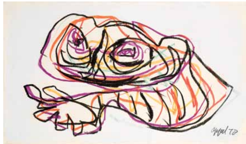
Karel Appel, Grenouille au repos, 1978, craie et acrylique sur papier, 63 x 37 cm.