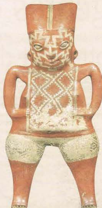
Déesse debout. Terre cuite creuse avec enduit rouge et décorations géométriques beiges et noires. Chupicuaro, Guanajuato, Michoacan, Mexico. Entre 400-100 av. J-C.