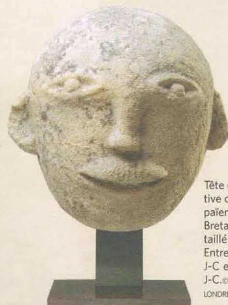
Tête d'homme votive celtique païenne, de Grande-Bretagne. Calcaire taillé à la main. Entre le I er siècle av. J-C et le I er siècle ap. J-C.