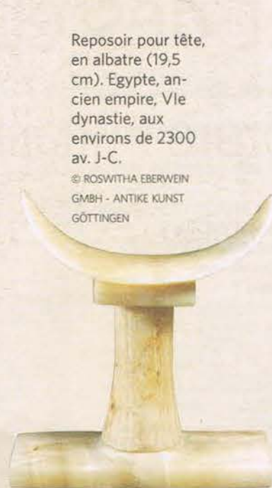
Reposoir pour tête, en albatre (19,5 cm). Egypte, ancien empire, VIe dynastie, aux environs de 2300 av. J-C.

A la Brafa, il y en a pour tous les goûts et (presque) toutes les bourses. Petite sélection en forme de ligne du temps parmi les pièces mises en évidence par les divers exposants.