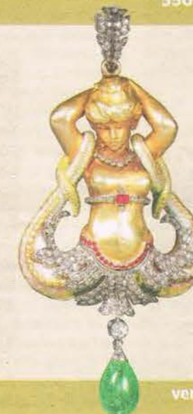
Rare pendentif représentant une sirène. Email, rubis, diamant, émeraude sur monture or et argent.

France, vers 1870.