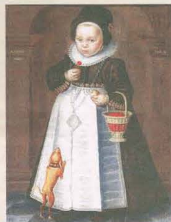
Portrait d'un jeune enfant portant une robe noire avec collier de dentelle et portant un panier de cerises. Jan Claesz, Haarlem ou Enkhuizen, 1606.