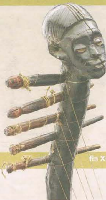
Harpe Zandé. Bois, cuir, fibres végétales. République démocratique du Congo, fin XIX e , début XX e . Provenance: Collection Gokelaere, Bruxelles.