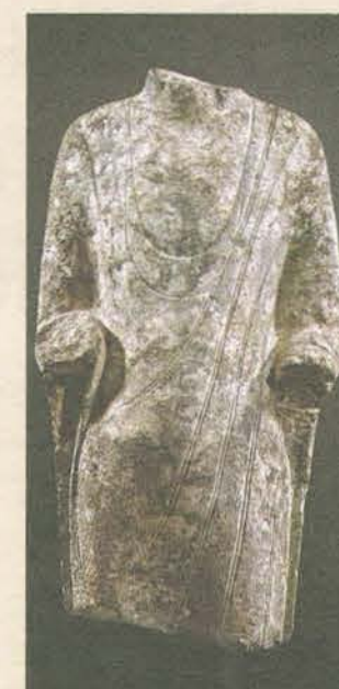
Torse de bouddha, calcaire gris. Chine, site de Qingzhou. Dynastie Qi du Nord, 550-557 ap. J-C.