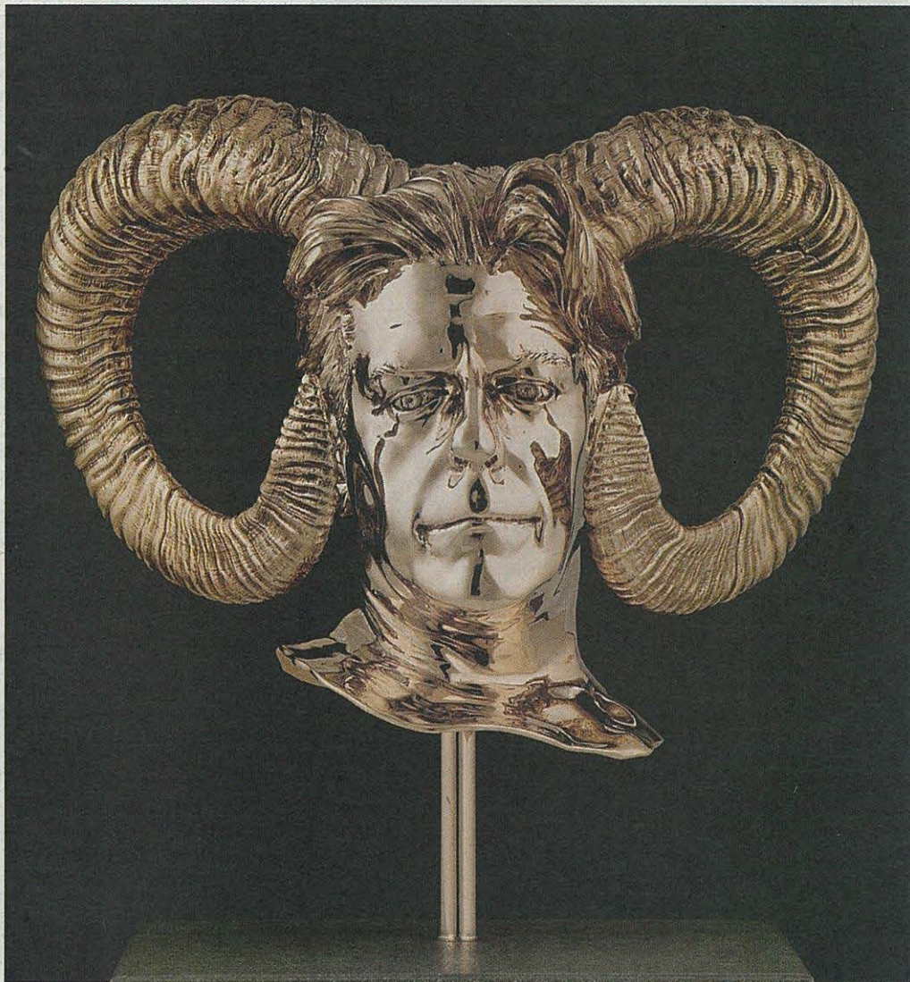
Jan Fabre (Anvers, 1958), bronze doré et poli, h 37 x l 48 x d 23 cm.