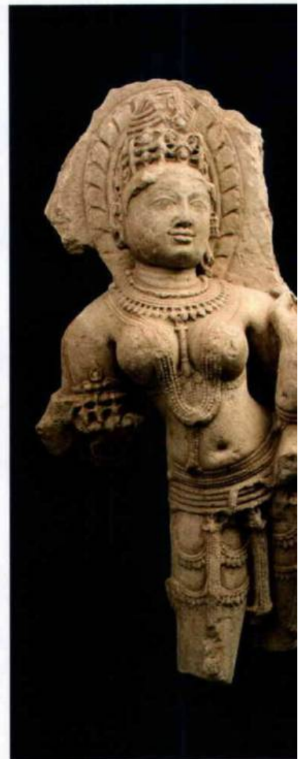
Représentation de la déesse hindoue Ambika, Rajasthan, Inde, XIIe siècle, marbre, h.: 96 cm.