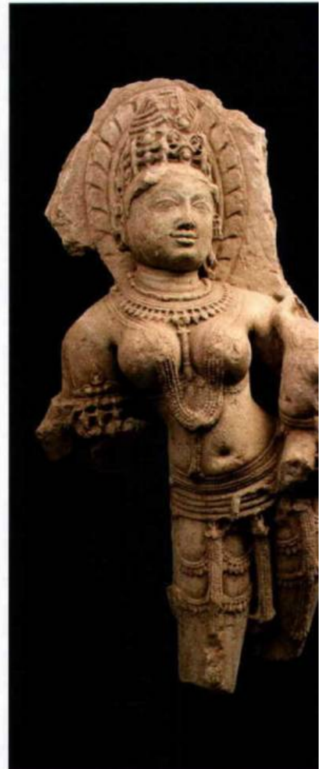
Voorstelling van de Hindu godin Ambika, Rajasthan, India, 12e eeuw, marmer, hoogte: 96 cm.